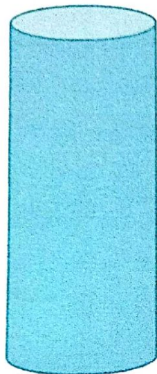
Кыргыз тили 87%

Ж.Маматжанов атындагы №58 орто мектебинин 2022-2023-окуу жылында 11-классынын I-чейреkte жетишкен билим сапатынын мониторинги.