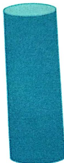
кыргыз адабияты 82%