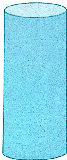
Кыргыз тили 87%

Ж.Маматжанов атындагы №58 орто мектебинин 2022-2023-окуу жылында 11-классынын I-чейреkte жетишкен билим сапатынын мониторинги.